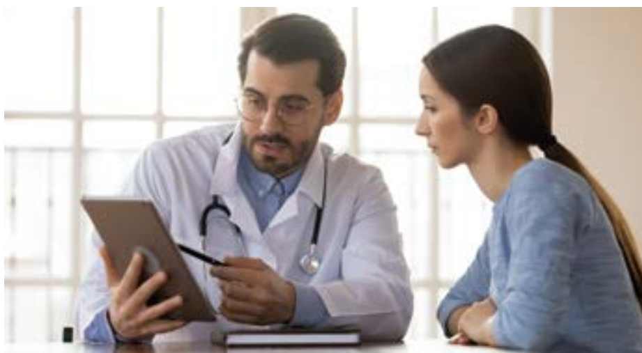
ilustraci foto: shutterstock.com

K tomu Nejvyšší soud ČR zaujal stanovisko, že podané dovolání obsahuje všechny náležité údaje a jde o záležitost dosud v judikatuře neřešenou, proto dovolání neodmítl, ale přijal,